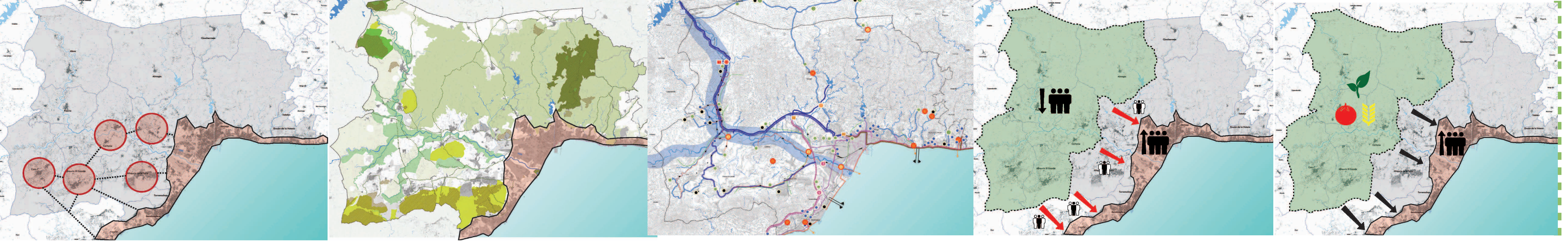
1. Conflictos en los usos del suelo > ciudades dormitorio 1ª residencia (urbano-agrarios) 2. Conflictos en los usos del suelo urbanización del campo (urbano-agrarios) 3. Conflictos en el uso del agua (urbano-agrarios) 4. Conflictos en la demanda de mano de obra (urbano-agrarios) 5. POTENCIAL > Amplía cartera de clientes de proximidad en la metrópolis de Málaga